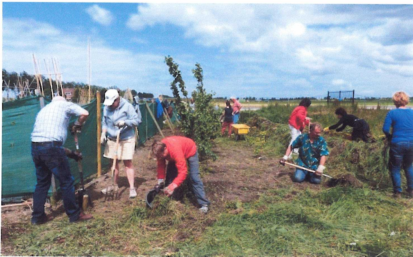
Tudorparkwerk groep april 2014